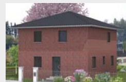
Ansicht mit Klinkerfassade